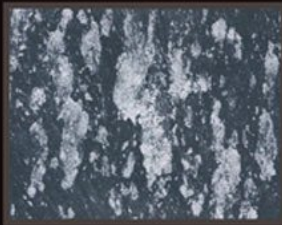
DECOR FONDO BLACK+ COLORI PREZIOSI "SILVER PEARL"