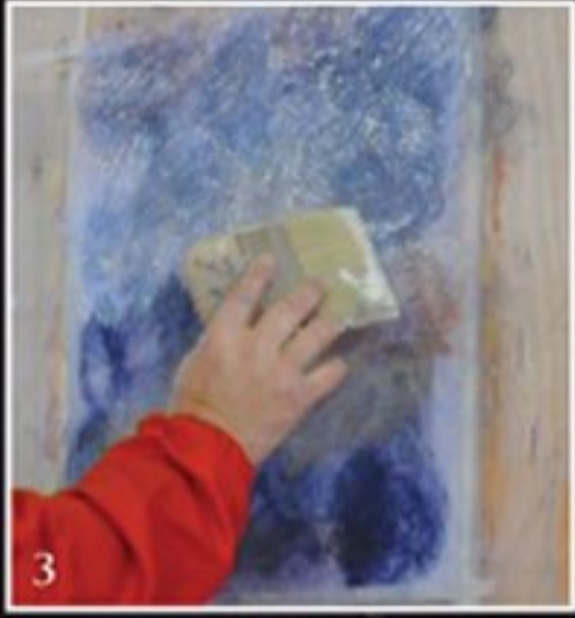
3 SILVER- GOLD FIRMAMENTO