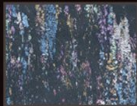
DECOR FONDO BLACK+ COLORI PREZIOSI "MIX PEARL"