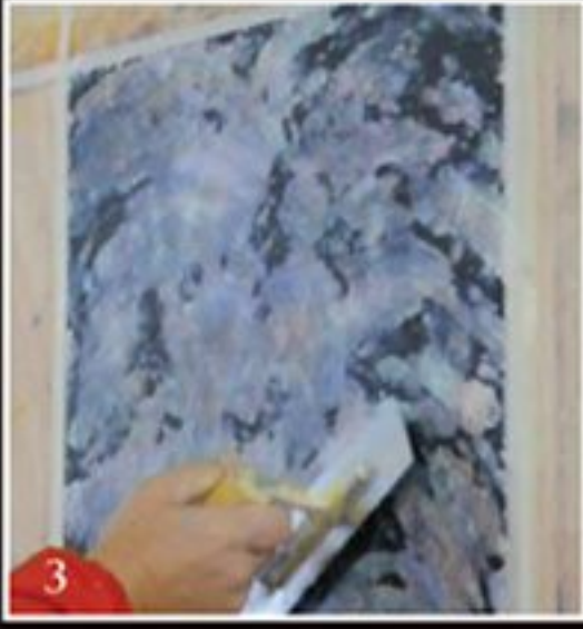
تهذيب الدهان بمعالج التيرا