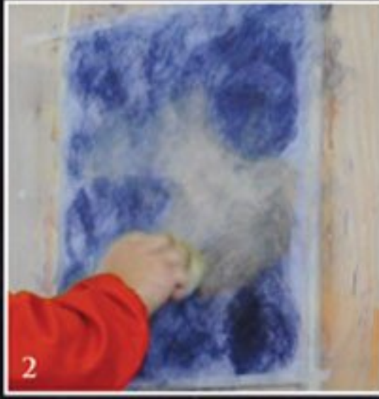
2 TN + PATINE CALCE