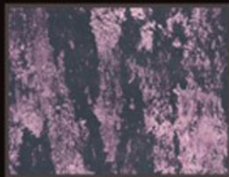
DECOR FONDO BLAC+ COLORI PREZIOSI "RED PEARL"