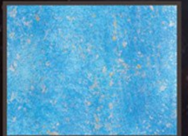
HYDROFONDO AM+ PATINE CALCE TN 022F+ FIRMAMENTO GOLD SILVER