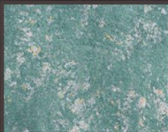
HYDROFONDO AM PATINE CALCE TN 021 F+ FIRMAMENTO GOLD SILVER