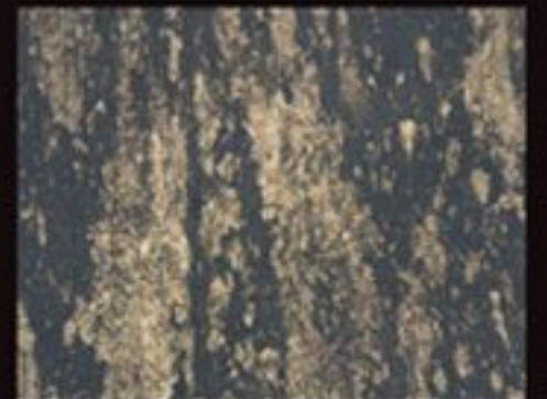
DECOR FONDO BLACK+ COLORI PREZIOSI "ORO ZECCHINO"