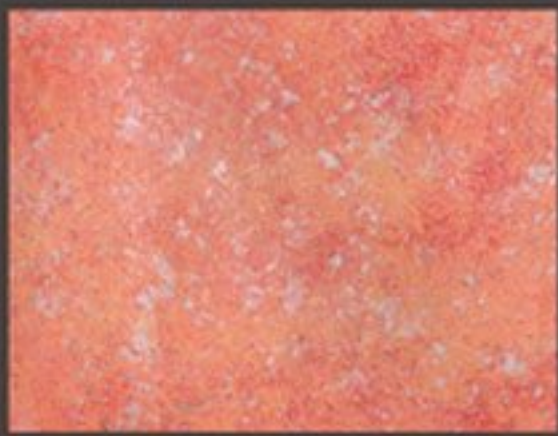
HYDROFONDO AM+ PATINE CALCE TN025F+ TN023F+ FIRMAMENTO GOLD SILVER

هذا ومن الضروري الاطلاع على طريقة الدهان الموجوده على قرص DVD الخاص بالماده واستشارة قسم الفني لدى شركة جنتريد لمعرفة المزيد .