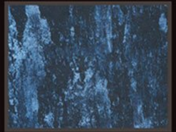
DECOR FONDO BLACK+ COLORI PREZIOSI "SKY PEARL"