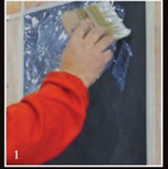
دهان اساس اسود