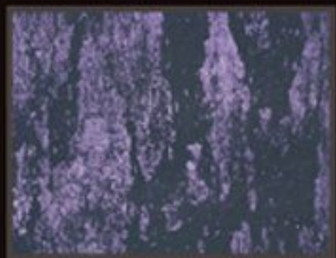
DECOR FONDO BLACK+ COLORI PREZIOSI "VIOLETTE PEARL"