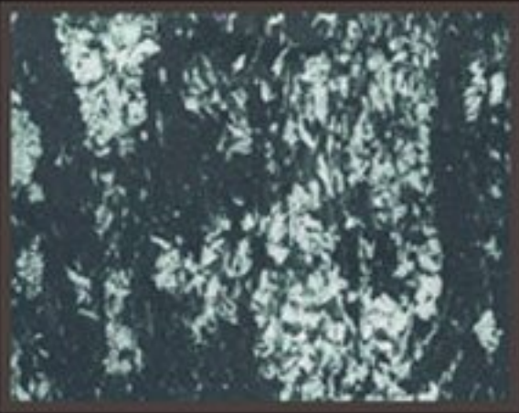
DECOR FONDO BLACK+ COLORI PREZIOSI "GREEN PEARL"

بعد دهان الاساس FONDO غالبا ما يكون باللون الاسود (يمكن استخدام الوان اخرى كالخمري - فضي) والتأكد من جفافه تماما يتم دهان مادة TERRE PREZIOSI بفرشاة التيرا او غيرها وقبل أن تجف المادة (وهي لا تزال تحفظ بطراوتها) يتم تهذيبها بمالج التيرا مالج الاستوكو بالطريقة التي يرغب بها الزبون هذا ومن الضروري الاطلاع على طريقة الدهان الموجوده على قرص DVD الخاص بالمادة واستشارة القسم الفني لدى شركة جنتريد لمعرفة المزيد .