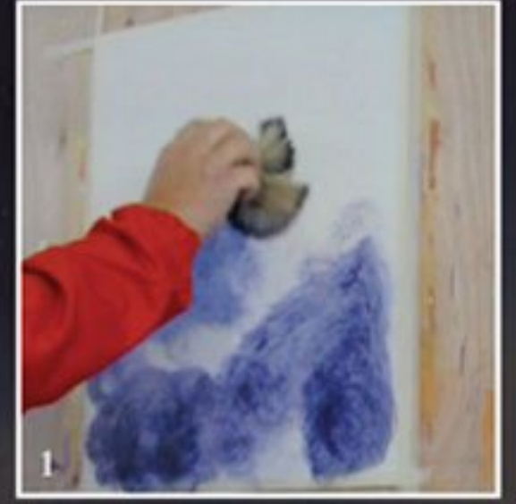
1 دهان اساس ابيض HYDROFONDO AM